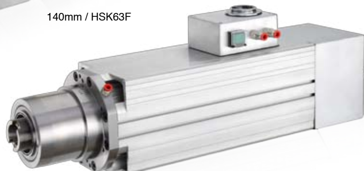
140mm / BT30, HSK63F / 24,000Rpm