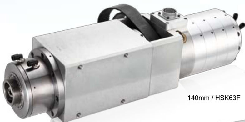
140mm / HSK63F

CNC木工機電主軸 CNC Wood-working machine spindles